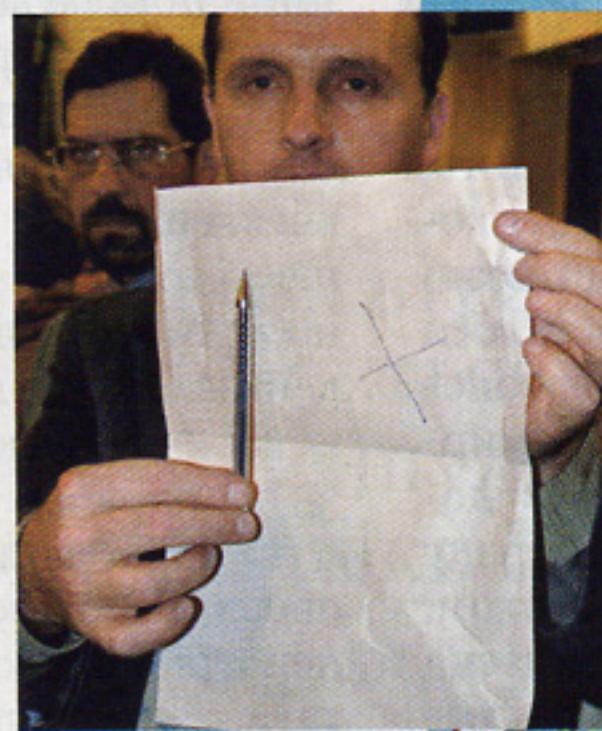
«ДИВО-РУЧКА». у 2004 році давала можливість у найпростіший спосіб отримати потрібний владі результат на виборах

Коли торік у листопаді Верховна Рада прийняла новий закон про вибори безпрецедентною для останнього часу більшістю голосів у 366 народних депутатів, поодинокі критичні заяви просто потонули в суголосному хорі ПР, БЮТ і ФЗ. Переважна частина опозиції переконувала в правильності рішення голосувати за